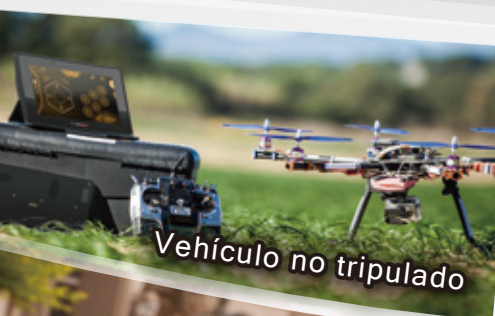
Vehículo no tripulado