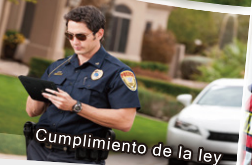
Cumplimiento de la ley