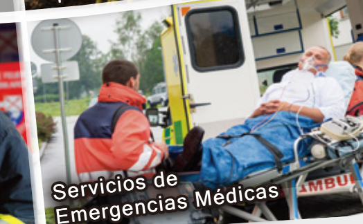
Servicios de Emergencias Médicas