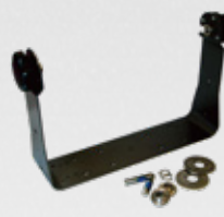
Soporte en forma de U